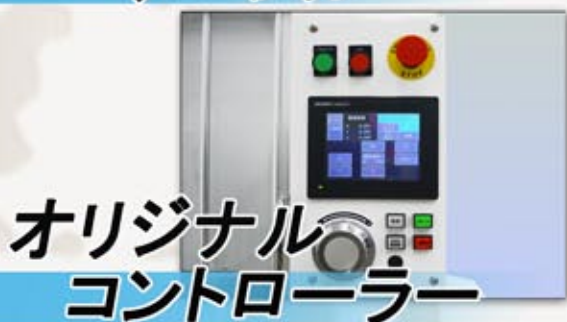
オリジナル コントローラー